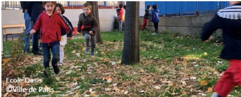
Ecole Oasis