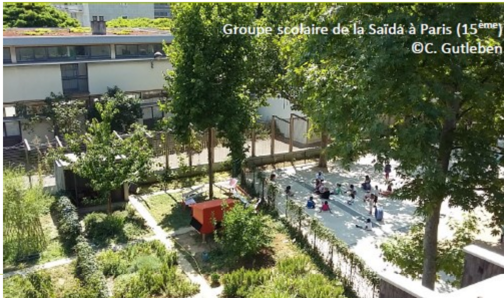
Groupe scolaire de la Saïdá à Paris (15 ème )